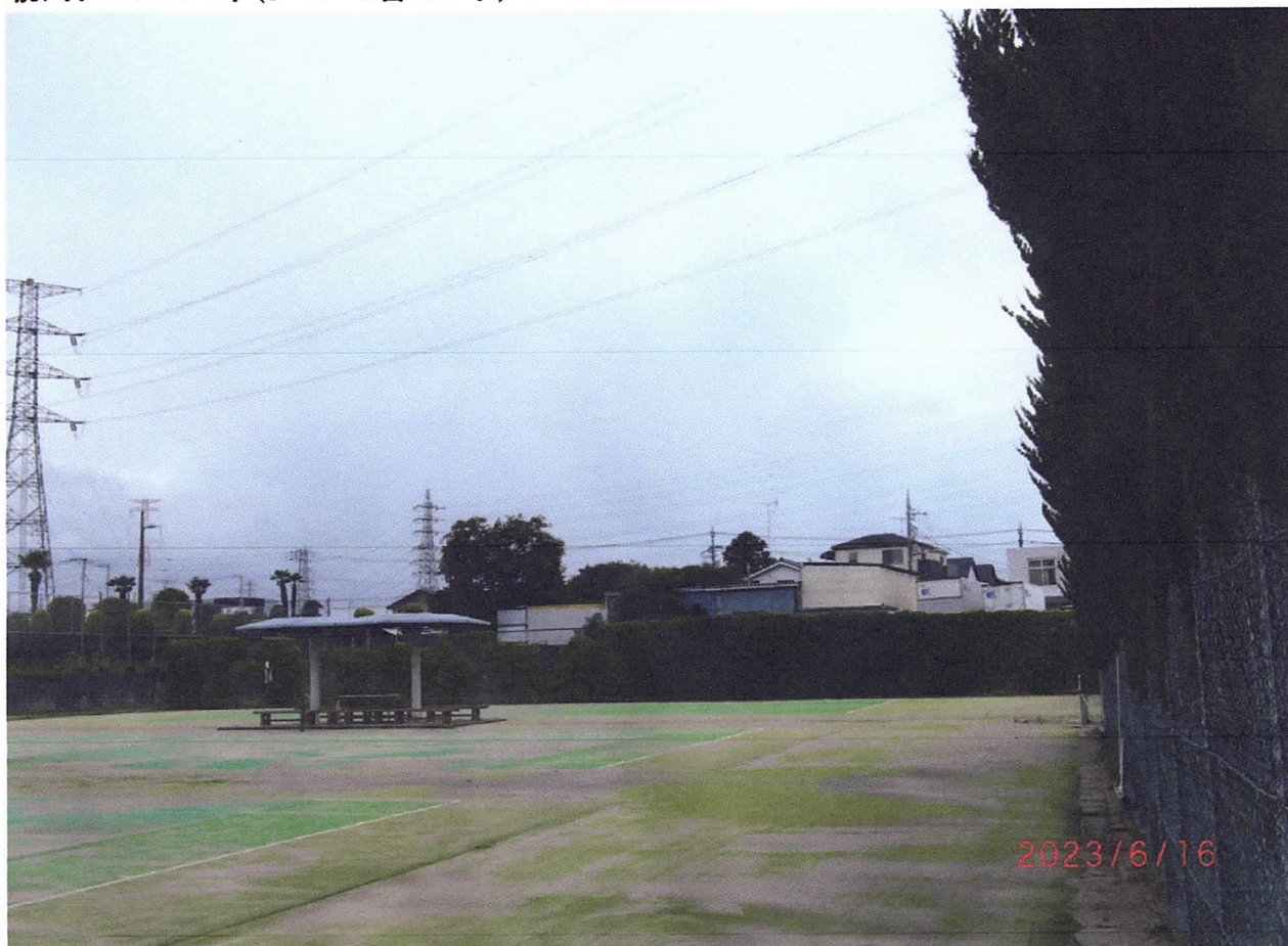
前川テニスコート(3・4・5番コート)