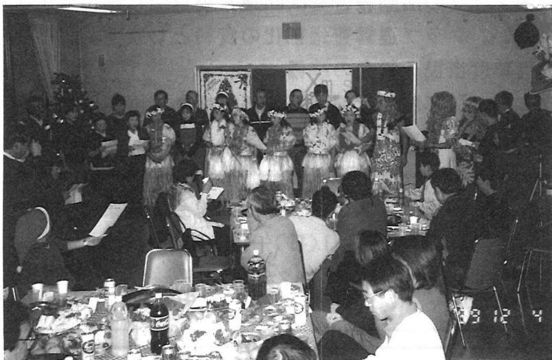
1999. 12. 4 市民テニスクラブ協議会納会

年頭にあたり市民テニス協議会の将来について、会員のみなさんと共に考えて行きましょう。会員のみなさんはもちろん、今年から会員になられたみなさんとともにテニスを楽しみ、お互いの交流を深めましょう。