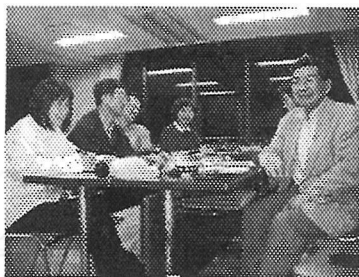
討議の進む編集委員会