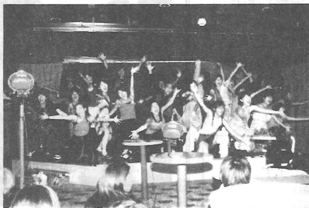
船内で行われたミュージカルショー(全員乗客)

最後に私の旅行記のために「ガット」の貴重な紙面を提供していただき、ありがとうございました。また、ご愛読を感謝申し上げます。