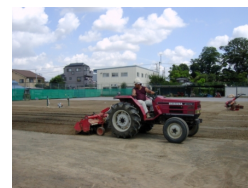
工事進行中。どんなコートになるか楽しみです。