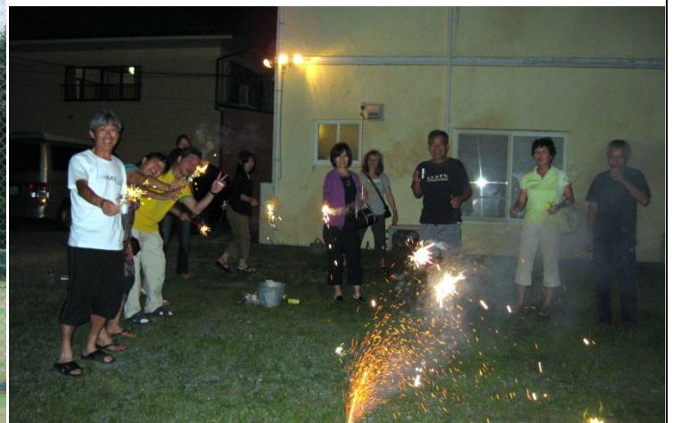
童心に戻って花火を楽しみました。

1位から選んでいくのですが、途中商品をめぐり“どっちが似合うか!”の争いも勃発!(Kさんvs Hさん)