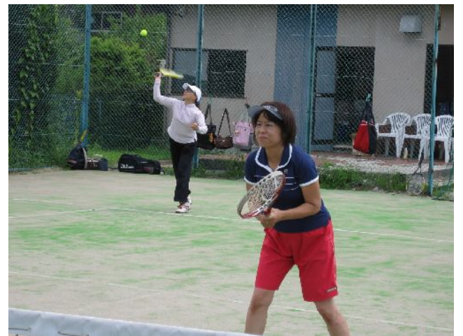
(飲むだけでなく、テニスもやりましたよ...)