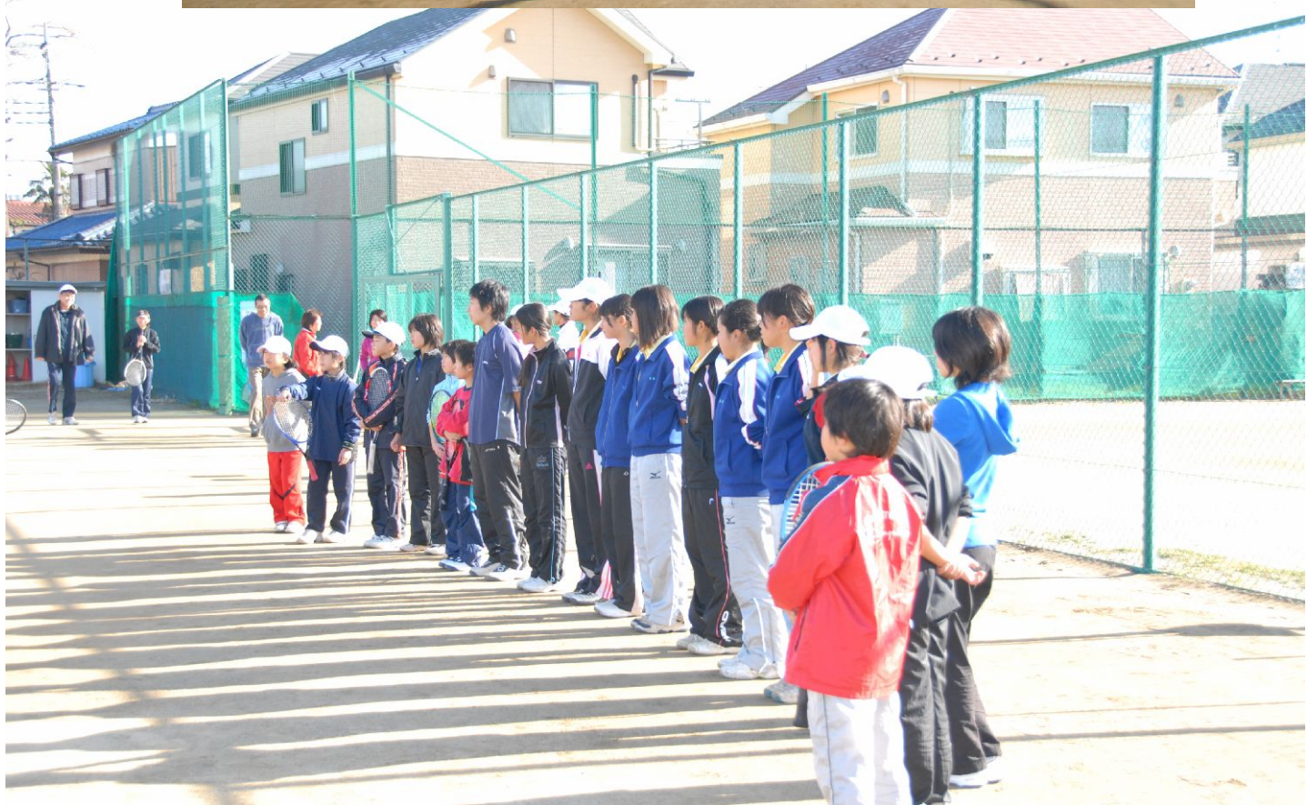
可愛いジュニア初打ち後