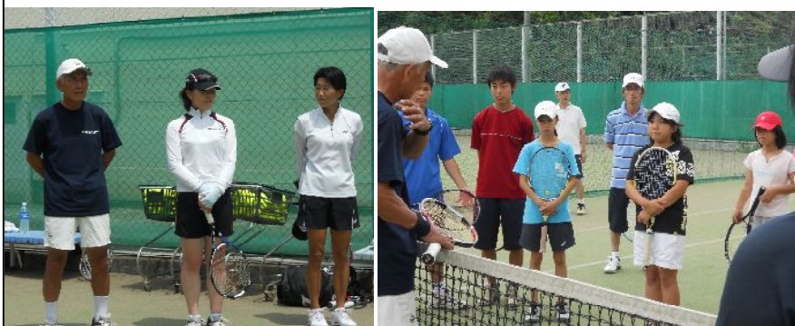
本井教室 1日目のコーチ