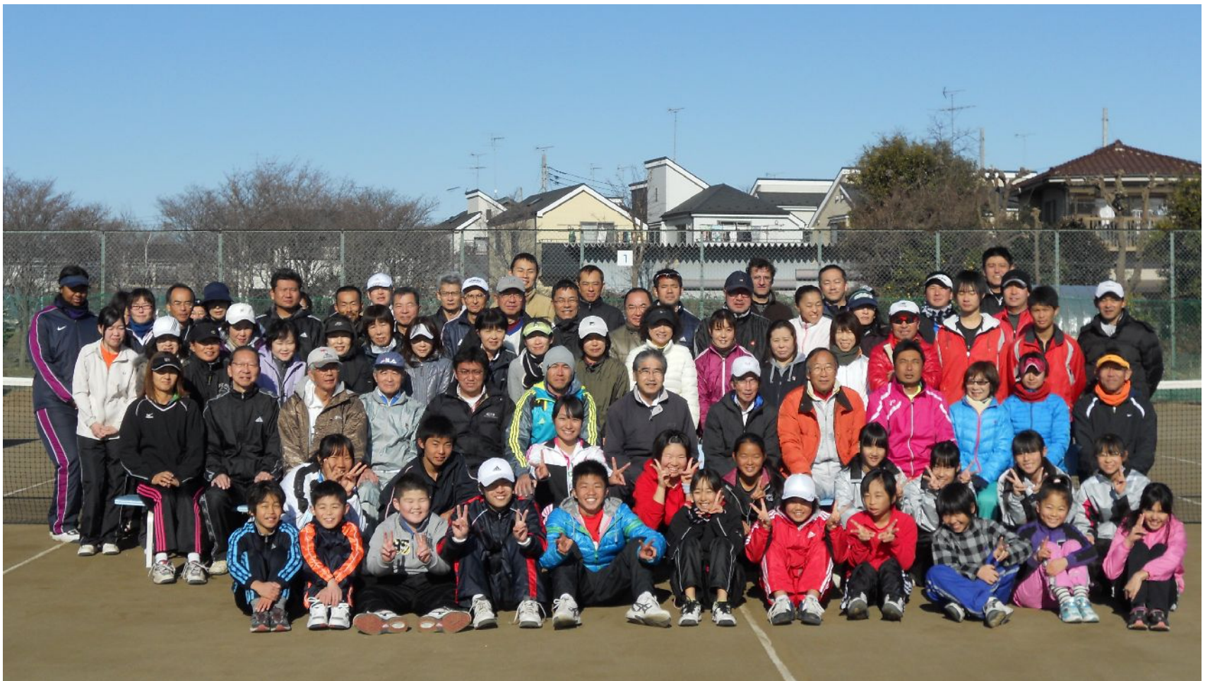
久米川コート 平成24年1月8日 初打ち集合写真