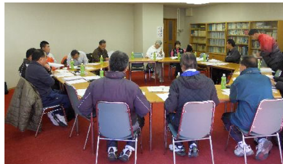
左写真 最後の運営委員会 残り4枚は24年度総会会場です。