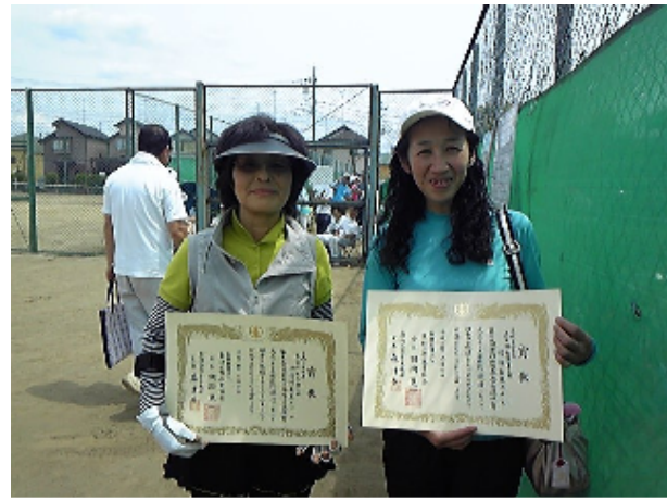
女子2部の優勝・準優勝チーム、ともに青葉クラブ！

今年の太田杯は男子が5月13日、女子が5月20日に晴天の久米川コートで行われました。残念ながら1部の優勝チームは、男子が日機装(A)、女子がJSS(A)と男女共に市民テニスクラブ以外という結果となってしまいました。来季は是非とも市民テニスクラブから優勝チームを輩出したいものです。皆さん、日頃の練習に励みましょう！