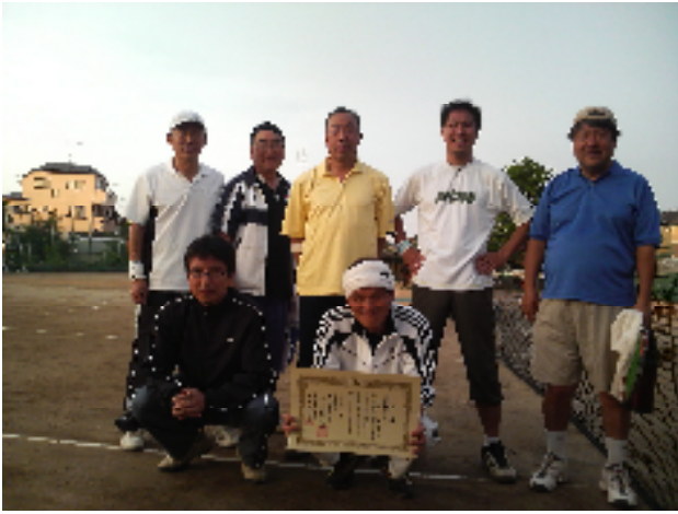
男子2部の優勝は諏訪Bチーム！