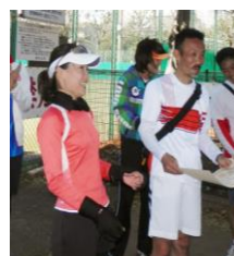
<笑顔溢れる表彰式>