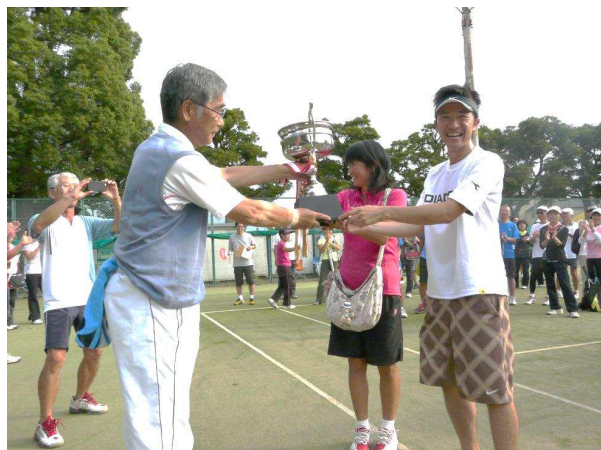
▲ 優勝しましたチームひまわりの皆様、おめでとうございます！