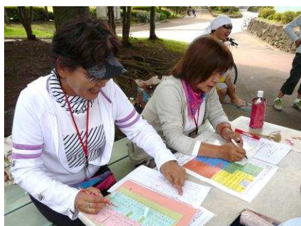
▲ 運営に携わって頂いた皆様、ありがとうございました。