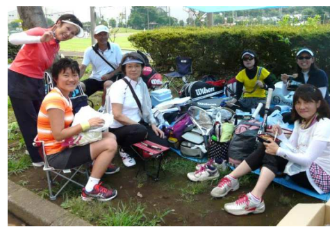
▲ プレー以外にも、大会の楽しみは盛りだくさんですね。