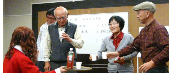
▲ 大変な盛り上がりとなったゲーム大会、皆さんの演技力には脱帽しました。テニスのフェイントにも活かさせよう？