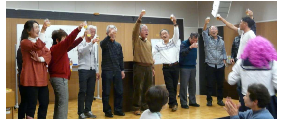
▲ ゲーム大会優勝は、チームひまわりでした。おめでとうございます。