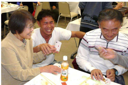
▲ おいしい料理とおいしいお酒、何より素晴らしいテニス仲間たちと楽しいひと時を過ごすことが出来ました。