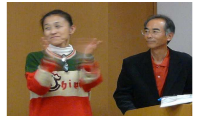
▲ 素晴らしい司会進行、ありがとうございました！

テニスコートでは、なかなか見られない皆さんの違う顔を見る事が出来、市民テへの愛着が、これまで以上に深まった一夜となりました。