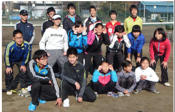
<ジュニア へん顔で集合！>