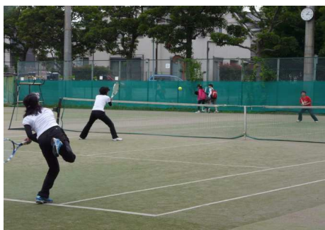
▲1球1球、すべてに全力！ 素晴らしい試合の連続でした！