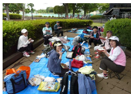
▲ほっと一息ついて皆さんでランチ