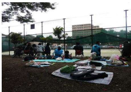
▲応援するほうにも、力が入りますね