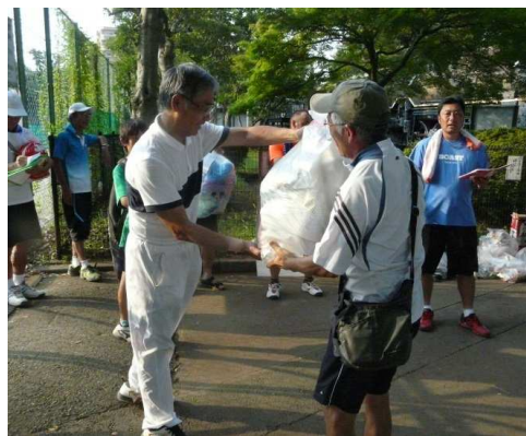
優勝おめでとうございます！ 副賞ラーメンは、“面”を大切に！ということだそうです