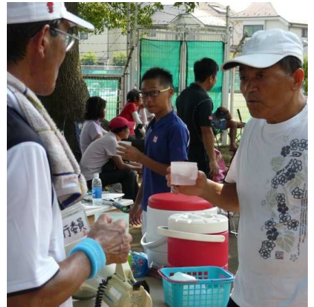
実行委員、運営委員の方々、 飲み物の手配等、細やかな ご配慮ありがとうございました