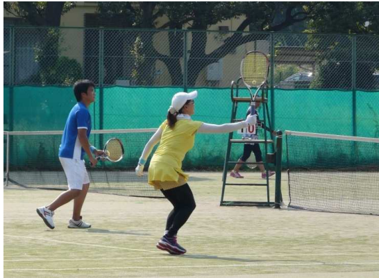
普段は組まない方々や、世代を超えた チームでのプレイ 柳杯ならではの光景ですね