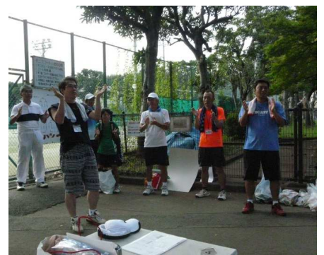
今年も、大きな怪我も無く、 楽しい大会でした。 既に心は、打ち上げの会場？