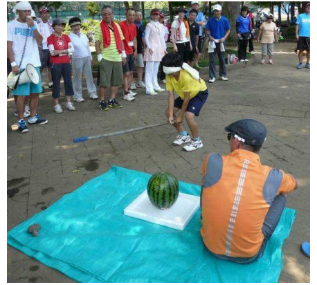
メインイベントのスイカ割りでは、 テニス以上に真剣でした