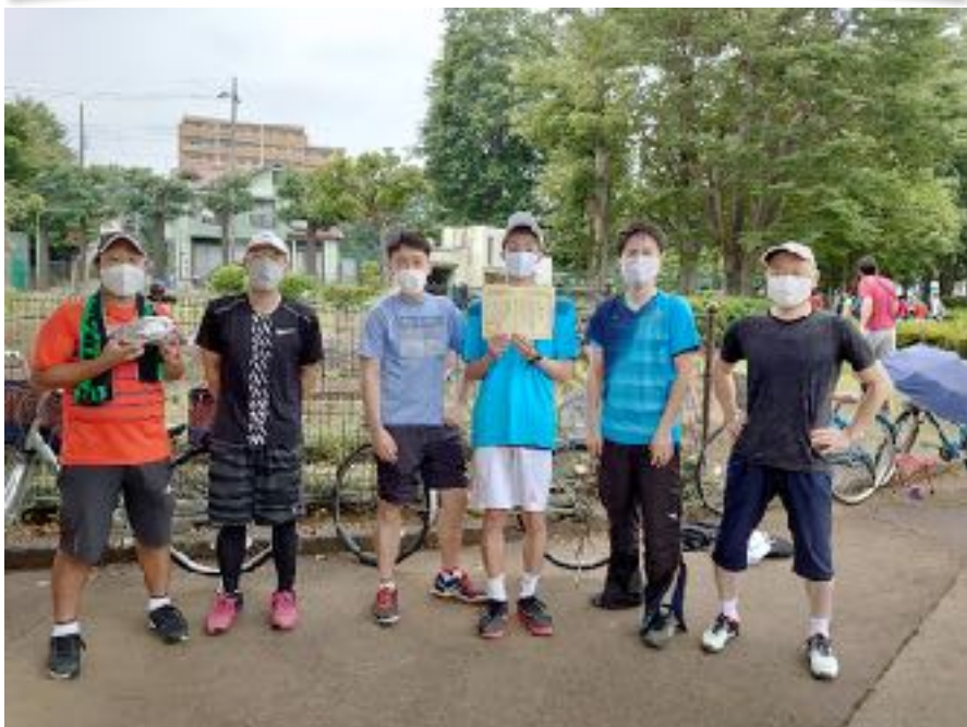
6月6日開催の太田杯にて天王森・秋葉倶楽部合同チーム 1部で3位

<スクール> 第二期 6月1日より開始 初心者・ジュニア：8：30～10：00 初級：10：10～11：40久米川コート