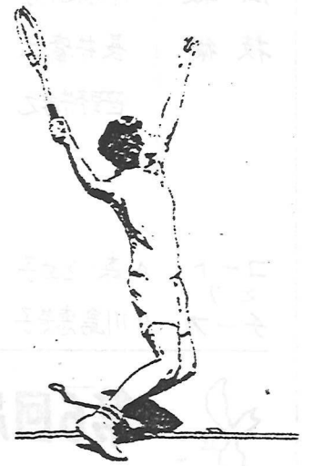
体をひねり、これから打つ動作に入ろうとするときには、両ひざをこのように曲げなければならない。