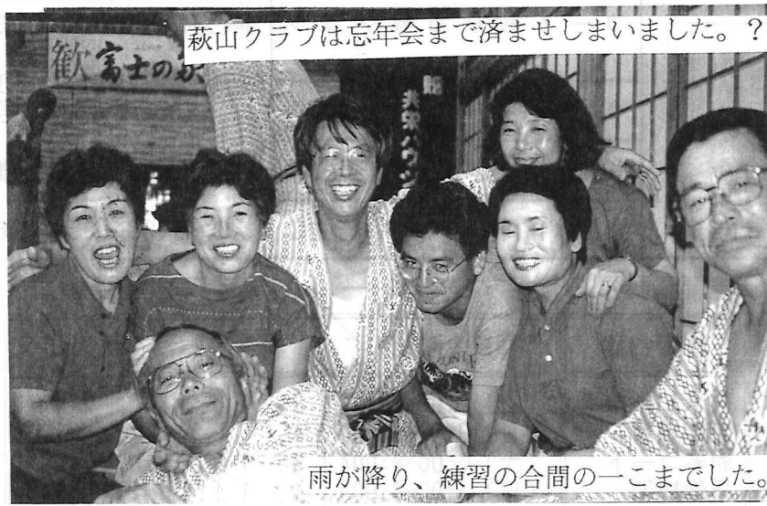
雨が降り、練習の合間の一コマでした。