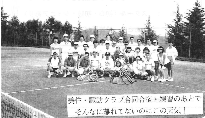
美住・諏訪クラブ合同合宿・練習のあとで そんなに離れてないのにこの天気!