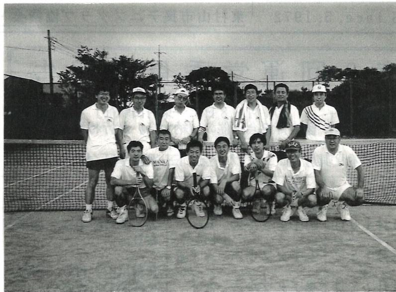
選ばれし団塊世代の面々

昨年の大好評に応え、今年もまたまた企画しました2-12345会合宿、市民テ団塊世代の男有志の集い