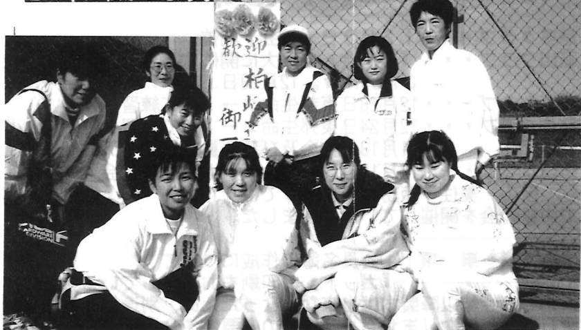
2日目・両市の選手団です(スポーツセンター-2F会場にて)