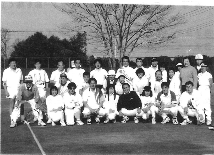
先般開催の「森教室」に参加され一段とレベルアップ (!!・?)し、意欲満々の方々です……。