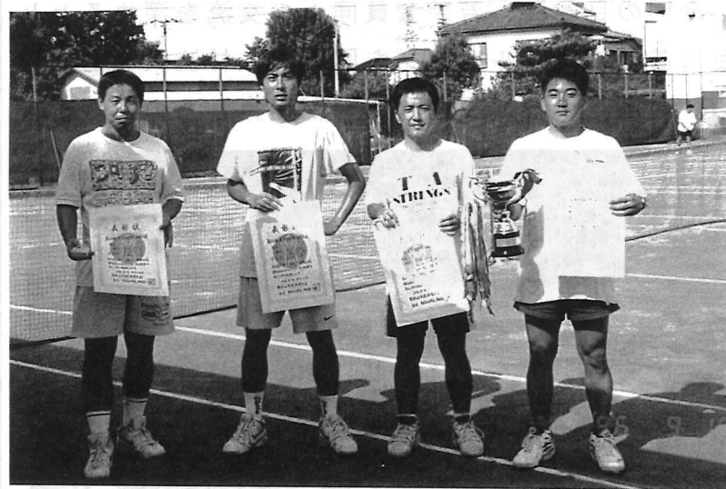
ラケットショップ "ラダ" による用具指導日は10月6日(日)10時 久米川コート。当日が雨天の時は、翌週になります。