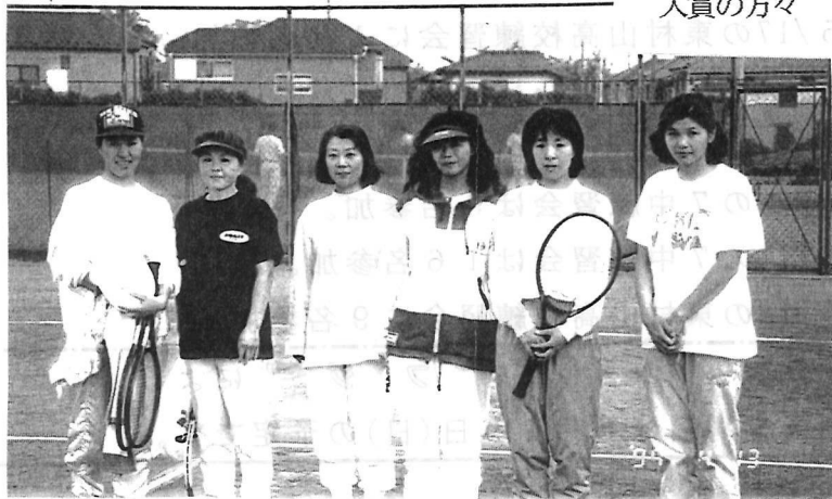
市民大会 女子B 入賞の方々