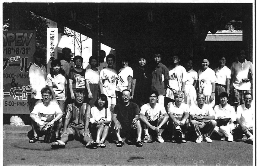
( 恩多クラブの合宿スナップ・その2 )