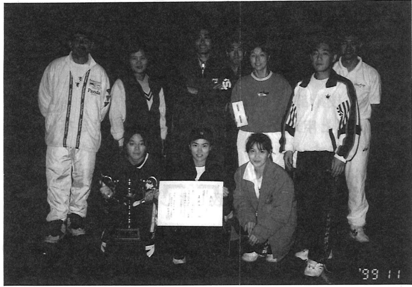
3年連続優勝の美住クラブ(A)チーム

優勝 美住クラブ(A), 準優勝 恩多クラブ(A) コンソレ 1位 美住クラブ(D), 2位 青葉クラブ(B)